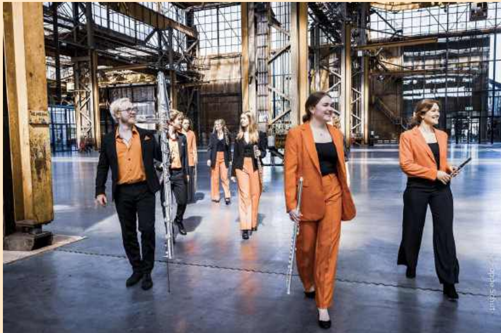
Fotoshoot Neflac Ensemble