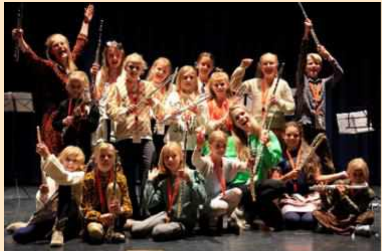
Windstreekdag in Heerenveen

Al met al waren de Windstreekdagen in Noord en West een groot succes, waar zowel leerlingen als docenten volop van hebben genoten!